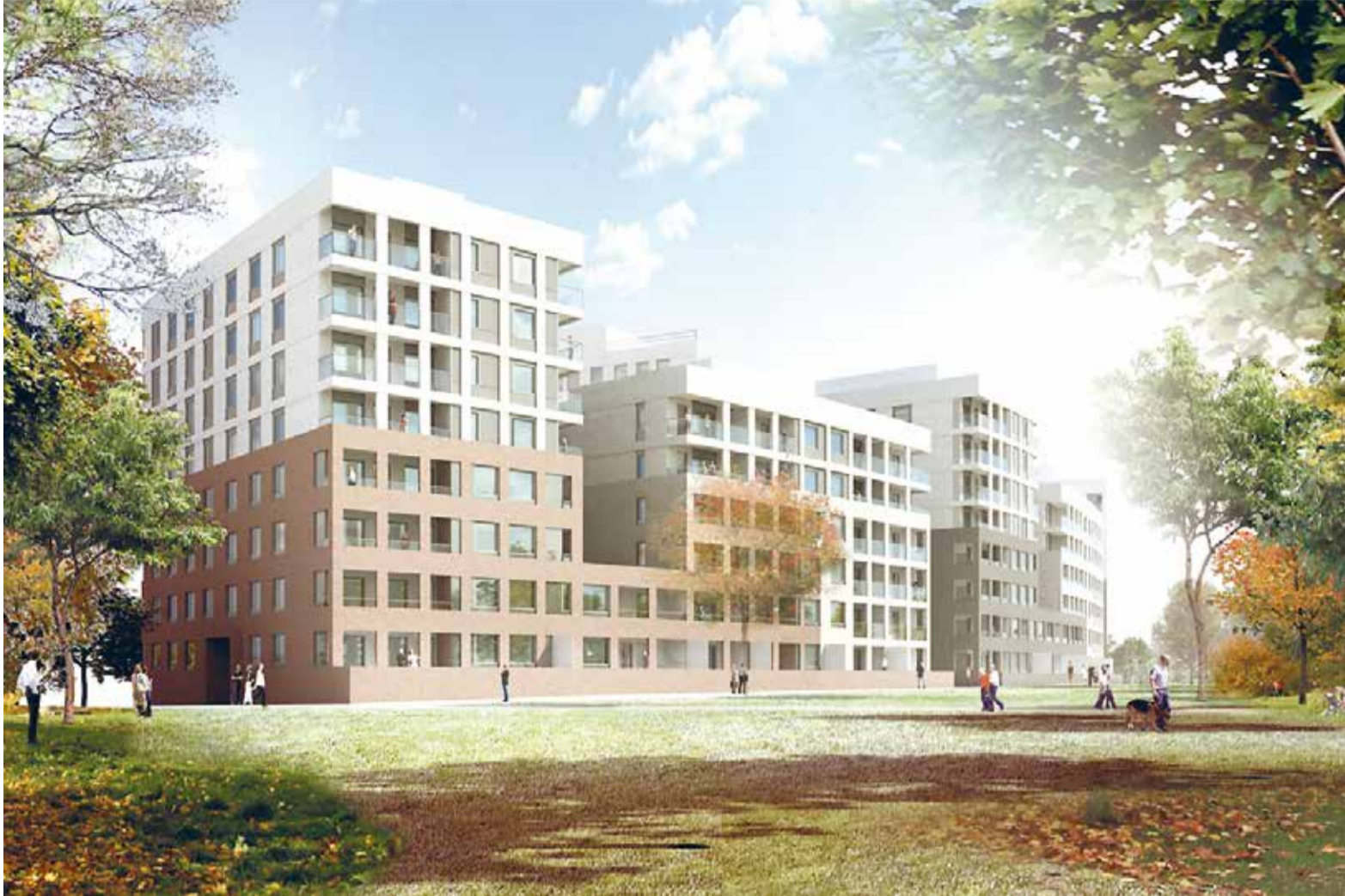
Rakennukset sijoittuvat Länsisatamankadun varteen Hyväntoivonpuiston ja Jätkäsaaren liikuntapuiston väliin jäävälle alueelle. Länsisatamankatu 37, näkymä puistosta.