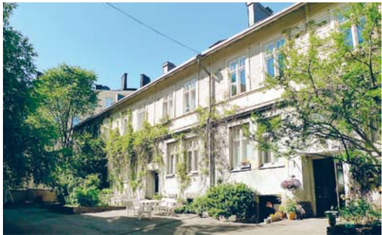
Tehtaankatu 19:ssä sijaitseva puutalo. Yksi kuudesta Ullanlinnan ja Punavuoren vanhoista puutaloista, joiden suojelemiseksi laaditaan asemakaavan muutosta.

Rakennukset sijaitsevat osoitteissa Kasarmikatu 20, Jääkärinkatu 6b, Tehtaankatu 19, Laivanvarustajankatu 9, Merimiehenkatu 10 ja Merimiehenkatu 14.